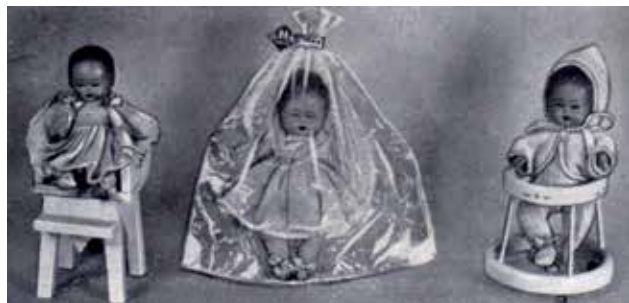
4 - Bamboline Oltolini in varie confezioni.