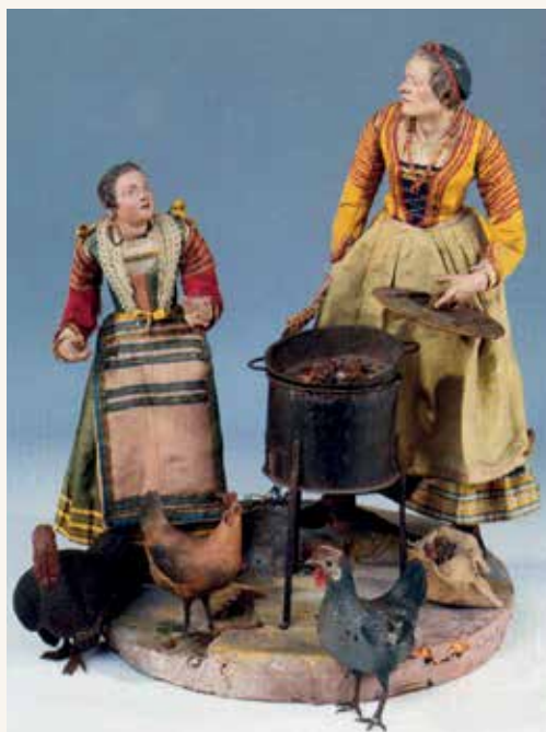
6 - Figure del presepe intente a svolgere delle attività quotidiane.

che avevano già una loro economia industriale stabile e sicura. L'Italia della metà dell'Ottocento era ancora dominata da altri Stati, ognuno con proprie regole, leggi e ordinanze, il che creò non pochi ostacoli alla nostra voglia di unificazione: nell'Italia Settentrionale c'era il Regno di Sardegna e il Regno delle due Sicilie sotto il dominio dei Borboni, mentre al nord troviamo il Regno Lombardo-Veneto facente parte dell'Impero Austro-Ungarico, al centro vari Stati legati al dominio austriaco per mezzo di parentele dovute a matrimoni combinati circondavano lo Stato Pontificio. È ovvio che tutto questo ha rallentato ogni tipo di sviluppo, impedendo anche l'evolversi dell'artigianato in industria. Negli animi degli italiani, però, iniziò a farsi