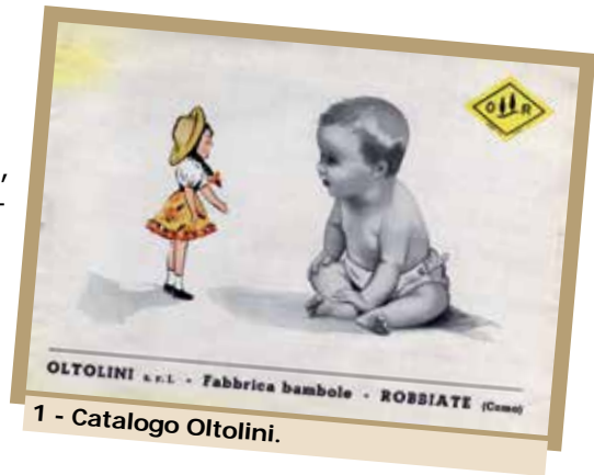
1 - Catalogo Oltolini.