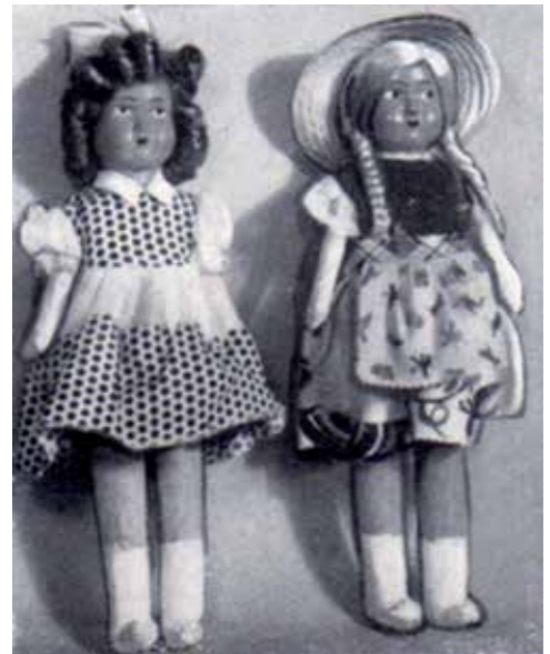
2 - Bambole Oltolini.