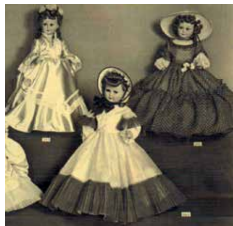
1 - Bambole vestite da damine.

Le damine, anche se in chiave attuale rispetto alla moda del momento (foto 7 e 8), saranno sempre una costante nella produzione della ditta. La serie "Les Petites Dames", bambole alte 41 cm e abbigliate con un certo gusto "retrò", fu prodotta tra gli anni Sessanta e Settanta e comprendeva i modelli: Martine (foto 9), Virginie, Brigitte, Veronique, Angélique (foto 10), tutte con nomi francesi, forse un tributo alla moda parigina, o probabilmente perché venivano esportate in Francia, come possiamo constatare da alcuni cataloghi. Infatti, la ditta, come tante altre, esportava all'estero con buon successo. Realizza anche la serie "Greta" ispirata alle bambole di biscuit francesi di fine secolo, riproponendo la cura artigianale negli abiti e nei dettagli. Verso la metà degli anni Sessanta, fanno la loro apparizione molti graziosi bebè, come Tobia, alto 24 cm, venduto con il suo seggiolone, o Claudio con la sua vaschetta per il bagnetto. Troviamo anche Pupo (foto 11) e Ciccio (foto 12) in due versioni. Alcuni bebè prodotti