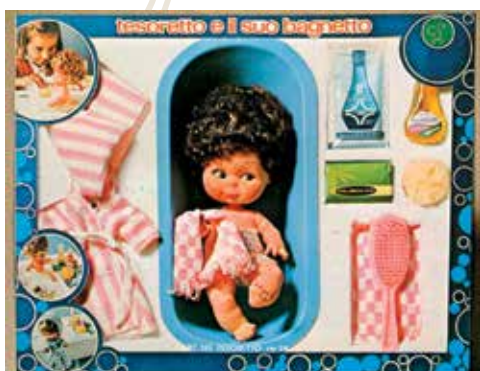
3 - Bebè Tesoretto e il suo bagnetto, 24 cm, anni '70.