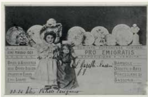
3 - Cartolina dell'Esposizione di Bambole e Oggetti d'Arte a Torino del 1903.