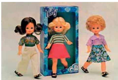
4 - Bambola Nelly in varie versioni.