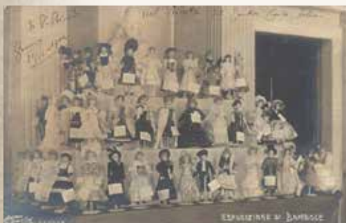
4 - L'Esposizione al Teatro Carlo Felice di Genova del 1904.