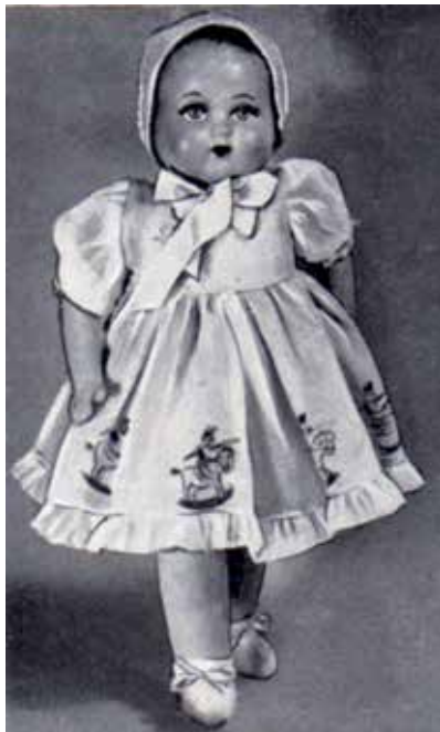
3 - Bambola Oltolini.