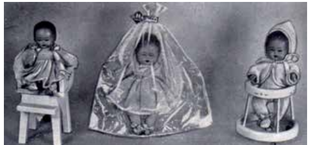
4 - Bambole Oltolini in varie confezioni.