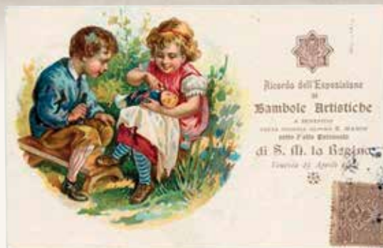
1 - Cartolina ricordo dell'Esposizione di Bambole Artistiche a Venezia nel 1900.

a Venezia, nel 1892, furono raccolte a Palazzo Fortuny e nel 1900 presentate con un'esposizione di Bambole Artistiche (foto 1); a Vercelli, nel 1902, ci fu una mostra memorabile di antiche bambole (foto 2); a Torino, nel 1904, un'esposizione di Bambole e Oggetti d'Arte (foto 3) e a Genova, nel 1904, al Teatro Carlo Felice (foto 4).