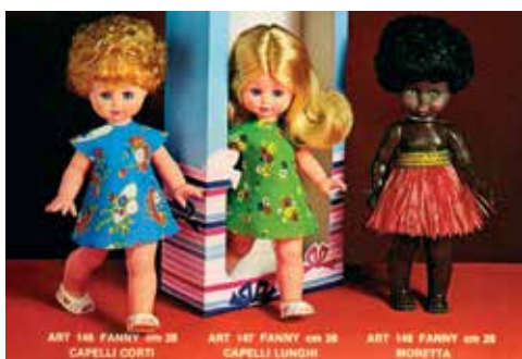
5 - Bambola Fanny in varie versioni.