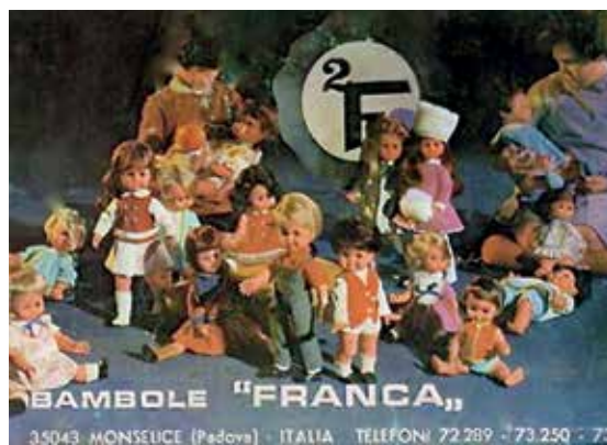
1 - Carrellata di bambole "Franca" anni '60.

In questi anni la ditta propone una curiosa bambolina piatta e completamente pieghevole dal nome "Piega Pieghella" da tenere in tasca, ma non riscosse il successo che in seguito avrà la famosa "Metti" della Sebino. Veniva venduta in una scatoletta di plastica dura trasparente ed era possibile sceglierla fra i tanti colori a disposizione. Nel 1968 la produzione si diversificò per un mercato più esigente producendo bambole e bebè abbigliati in modo più ricercato e destinati ai grandi magazzini di tutto il mondo. La ditta intuisce da subito che prima o poi il mercato italiano si sarebbe saturato e così indirizza la sua produzione verso sbocchi internazionali. Una bambola, uscita dalla fabbrica proprio in questo anno è Martina (foto 2 e 3) di "nuova generazione", come recita lo slogan, perché cammina grazie al suo funzionamento a batteria. Si presenta in diverse versioni, perché ha diversi colori d'abito.