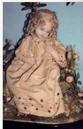
5 - Bambola in cera.

Nel Rinascimento, con il raffinarsi delle arti, le bambole cominciarono ad acquistare e consolidare una loro originalità, ma è difficile stabilirne la provenienza. Dall'inventario personale di Caterina de' Medici, sappiamo che alla sua morte, avvenuta nel 1589, facevano parte sedici bambole in legno, delle quali otto vestite a lutto. In genere, queste bambole, avevano la testa e il busto in legno, intagliate e dipinte in modo semplice, con una bocca scarlatta e tocchi di rosso anche sulle guance. Le parrucche erano fatte con capelli veri o in fibre naturali. Le braccia potevano essere smontate per meglio permettere la loro vestizione mentre le gambe erano spesso inesistenti e al loro posto si trovava una specie di gabbia conica che faceva da supporto ai vaporosi abiti con cui veniva abbellita la bambola. Essa aveva spesso un ricco corredo contenuto con cura in scatole di legno foderate in seta e pizzo. Le bambole avevano abiti in broccato o in velluto di color "cremisino". Anche Eleonora D'Aragona duchessa di Ferrara acquistò e inviò a Milano ad Anna Sforza, fidanzata del figlio Alfonso D'Este I, una bambola con tutto il suo corredo. Tra le nobili dame