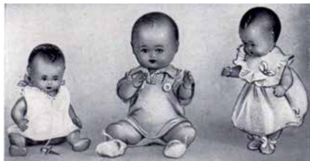
5 - Bambole in camicia.