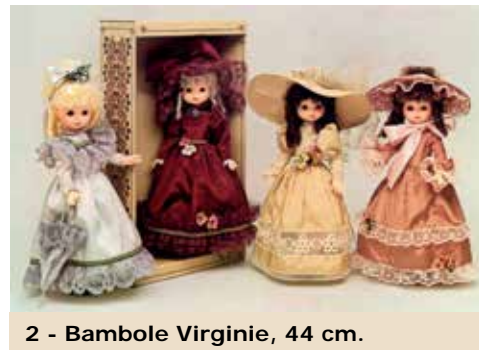
2 - Bambole Virginie, 44 cm.