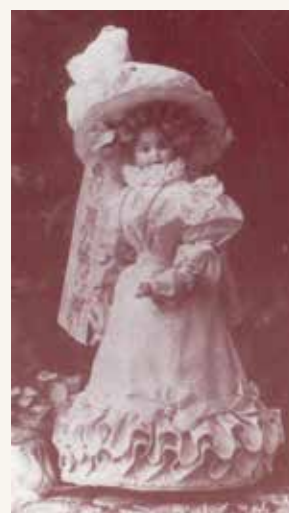
2 - Bambola esposta a Vercelli, 1902.