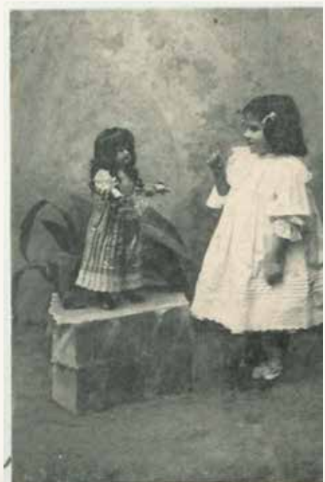
7 - Cartolina Postale raffigurante una bambina con la sua bambola, 1902.

Anton Maria Maragliano (1664-1741) fu un insigne scultore genovese che si dedicò all'esecuzione di figure per il presepio raggiungendo eccellenti risultati; i volti delle sue opere esprimevano un'intensa spiritualità. Anche Sammartino e Domenico Vaccaro furono degli scultori napoletani del Settecento abili sia nella lavorazione delle figure che nella realizzazione dei loro costumi, fatti con stoffe pregiate e ricche di ornamenti e monili.