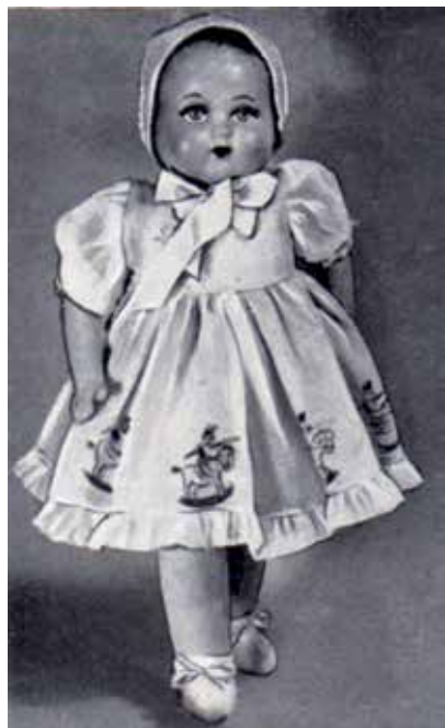
3 - Bambola Oltolini.