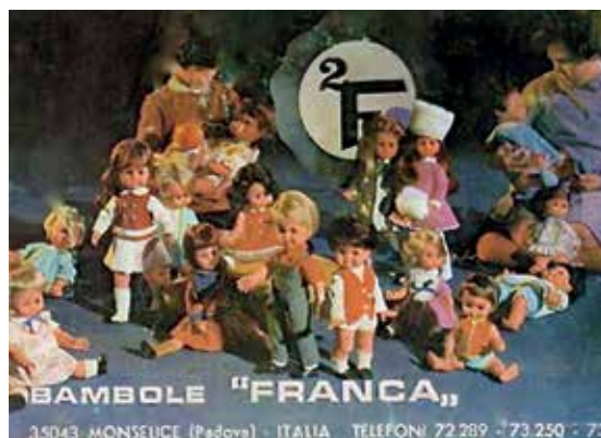
1 - Carrellata di bambole "Franca" anni '60.

Nel 1968 la produzione si diversificò per un mercato più esigente producendo bambole e bebè abbigliati in modo più ricercato e destinati ai grandi magazzini di tutto il mondo. La ditta intuisce da subito che prima o poi il mercato italiano si sarebbe saturato e così indirizza la sua produzione verso sbocchi internazionali. Una bambola, uscita dalla fabbrica proprio in questo anno è Martina (foto 2 e 3) di "nuova generazione", come recita lo slogan, perché cammina grazie al suo funzionamento a batteria. Si presenta in diverse versioni, perché ha diversi colori d'abito.