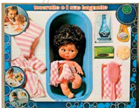
3 - Bebè Tesoretto e il suo bagnetto, 24 cm, anni '70.